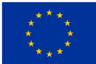
European Union European Regional Development Fund

GLAVNI CILJ: stvaranje radnih mjesta i povećanje konkurentnosti