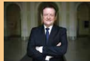
Prof. dr. sc. Damir Boras, rektor Sveučilišta u Zagrebu

Republike Hrvatske, a uz veliku potporu Ministarstva obrane Republike Hrvatske, uspjeli smo uspostaviti dva studijska programa koja su prepoznali maturanti diljem Hrvatske. O njihovoj kvaliteti i atraktivnosti svjedoči i podatak da je upisna kvota na svakom od tih programa popunjena izvrsnim kandidatima te da je zanimanje maturanata za upis na njih vrlo velik. Suradnjom Sveučilišta u Zagrebu, kao najvećega i najstarijega sveučilišta u Republici Hrvatskoj te Hrvatskoga vojnoga učilišta kao središnje visokoobrazovne ustanove Oružanih snaga RH uspostavili smo dva nova integrirana civilno-vojna programa koji se svojom kvalitetom mogu mjeriti sa sličnim vrhunskim studijima u inozemstvu. Izvrsnosti tih dvaju studija svakako doprinosi i činjenica da u njihovu izvođenju sudjeluje velik broj nastavnika i stručnjaka iz raznih znanstvenih područja, polja i grana, što im daje dodatnu interdisciplinarnu vrijednost. Uprava Sveučilišta u Zagrebu i dalje snažno potiče suradnju s Hrvatskim vojnim učilištem koja je primjer sinergijskoga djelovanja partnerskih institucija u Republici Hrvatskoj.