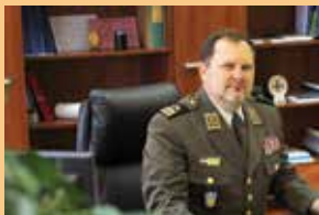
general-pukovnik dr. sc. Slavko Barić, zapovjednik HVU-a

Poštovani čitatelji, ovim vodičem želimo vam predstaviti Hrvatsko vojno učilište kao središnju vojnoobrazovnu ustanovu Oružanih snaga Republike Hrvatske nastalu na samom početku Domovinskog rata. Tijekom godina razvoja programi za obrazovanje časnika i dočasnika mijenjali su se i prilagođavali novim potrebama. U ovoj je obrazovnoj ustanovi dio svog znanja i sposobnosti steklo više od 36 000 pripadnika Oružanih snaga, od vojnika, dočasnika i časnika do generala. Nakon provedenog preustroja Oružanih snaga Republike Hrvatske, ulaska Republike Hrvatske u punopravno članstvo NATO saveza i ulaska u Europsku uniju, Hrvatsko vojno učilište pred novim je izazovima. Akreditiranjem preddiplomskih sveučilišnih studijskih programa i razvojem cjelokupnih obrazovnih programa i sadržaja namjera nam je podići kvalitetu osposobljavanja časnika i dočasnika OSRH te tako postati poznata i priznata vojnoobrazovna ustanova u zemlji i inozemstvu.